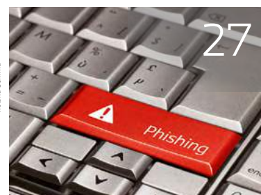
27 Gefährliche Tasten ...