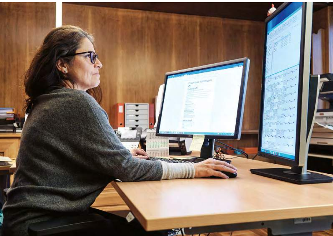
▲ ... direkt am Computer in den Dokumenten vermerkt. Das spart mehrere Arbeitsgänge.

Schreibt man «anfangs 2021» oder «Anfang 2021»? Heisst es «im besonderen» oder «im Besonderen»? Ist «1960er-Jahre» korrekt oder doch «1960er Jahre»? Auch sprachgewandte Schreiber haben manchmal ihre liebe Mühe mit den orthografischen (oder ortographischen?) Finessen der deutschen Sprache. Dann greifen sie entweder zum Duden oder wenden sich an ein Korrekturbüro wie die Rotstift AG. 1991 in Basel gegründet, ist das Unternehmen mit Sitz an der St. Jakobs-Strasse heute das grösste unabhängige Korrekturbüro der Schweiz. Es be-