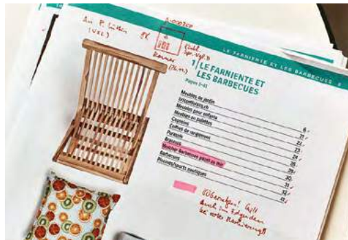
▲ Die Textkorrekturen werden bei der Rotstift AG seit 2019 nicht mehr traditionell von Hand auf Papier, sondern ...

Kaum ein Unternehmen kann es sich heute noch leisten, die Digitalisierung zu ignorieren. Kleinere Betriebe verfügen aber oft nicht über genügend Ressourcen, um die digitale Transformation aus eigener Kraft zu bewältigen. Sie erhalten in unserer Region Unterstützung von der Initiative «be-digital» der Handelskammer beider Basel.