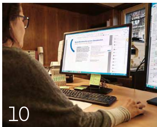
10 Neue digitale Abläufe bei den KMU