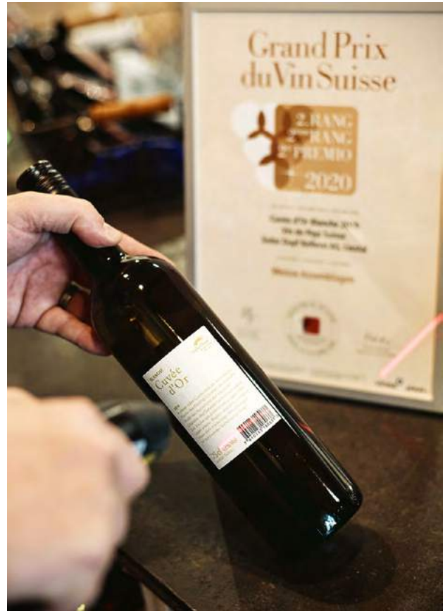
Auf der Weinflasche gibt es den Barcode schon, doch in der Logistik der Siebe Dupf AG wird er noch nicht verwendet.

«Zuerst führten wir das digitale Korrigieren ein, und als Nächstes folgte der Ersatz von veralteten Geräten und Computer-Betriebssystemen durch «virtuelle» Arbeitsplätze», sagt CEO Jung. «Diese sind mit einem Rechenzentrum verbunden, das unseren Mitarbeitenden rund um die Uhr und an jedem beliebigen Standort zur Verfügung steht. Mit jedem Laptop, Tablet oder Smartphone und natürlich einem Internetzugang können sie nun von überall her über gesicherte Verbindungen auf alle Dokumente und Arbeitsgeräte zugreifen, die sie